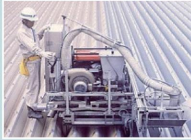
折版屋根自動塗装機(特許)

当社が開発した折版屋根の「自動ケレン機」「自動塗装機」(平成14年特許取得済み)により省力化、安全性向上、工期短縮を実現しました。折版だけでなくあらゆる構造物の塗装工事も行っています。