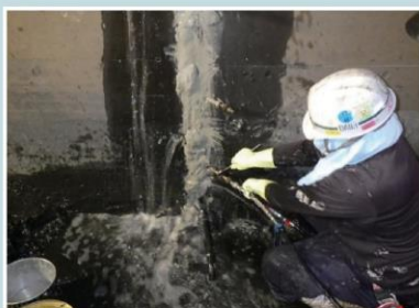
加圧注入工(バンドフレキシシ工法)

バンドフレキシシ工法は、漏水箇所を完全に止水するための工法で、極めて低粘度の二成分系合成樹脂をコンクリートの漏水部分に高圧で注入する工法です。充てんされた注入剤は、高弾性樹脂となり、最高水準の止水効果を発揮します。