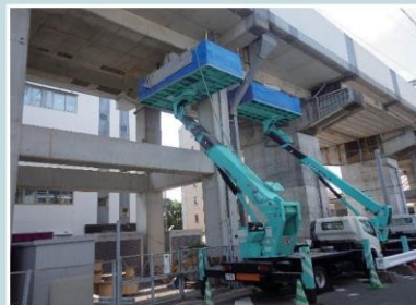
鉄道高架橋断面修復工