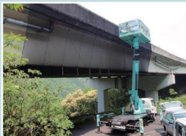
道路橋剥落対策工

構造物は日々の維持補修を通して安全性・快適性を保ち、その機能を十分に発揮することができます。老朽化を遅らせる計画的な維持補修や耐震補強、老朽化した橋梁の補修や塗り替え、剥落対策工事などを行っています。