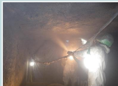
躯体補修工(吹付け)