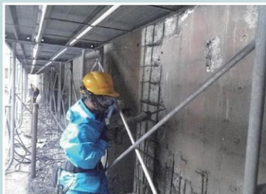
躯体補修工(はつり)