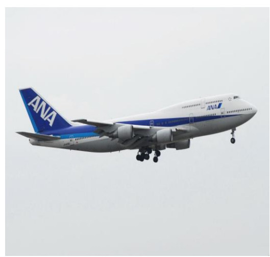
航空機用塗料「スカイハロー」