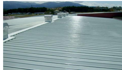
屋根用遮熱塗料「パラサーモシリコン」