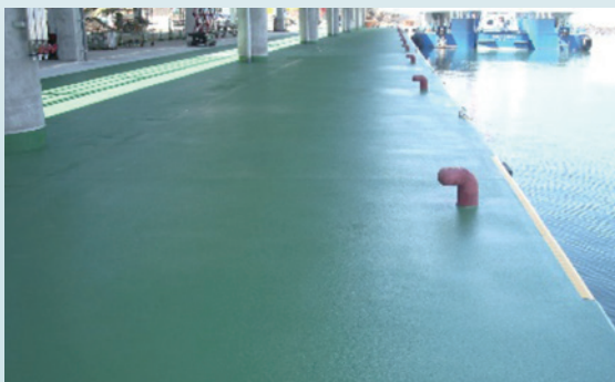
[ 高知県宿毛市 ]