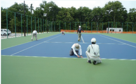
[ 滋賀県大津市 ]