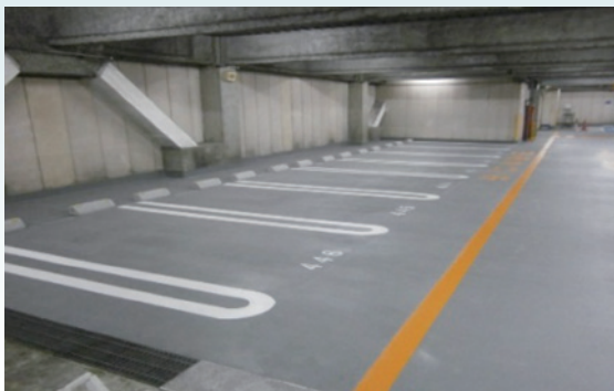
[ 岡山市 ]