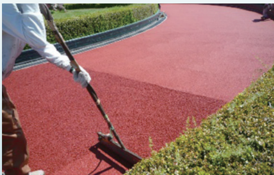
[ 広島市 ]