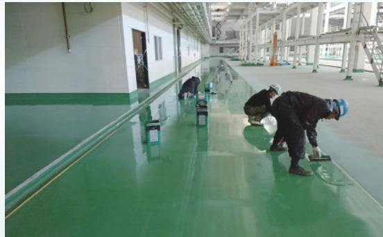
[ 群馬県高崎市 ]