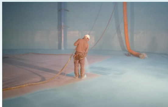
[ 東広島市 ]