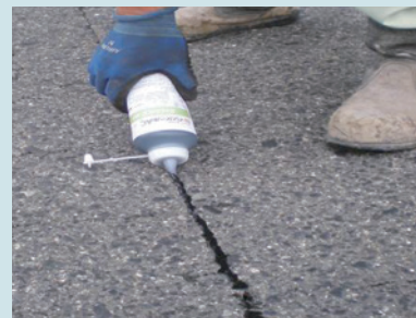
(ボトル式携帯用簡易充填剤)