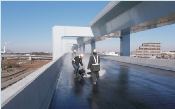
[ 神奈川県茅ヶ崎市 ]