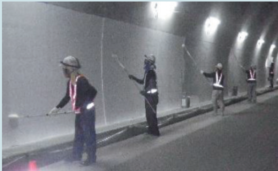
[ 北海道小樽市 ]