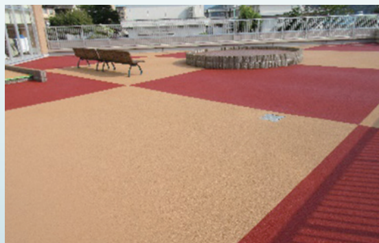
[ 広島市 ]